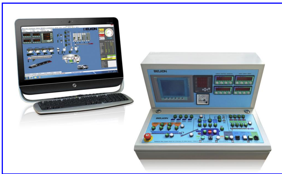
Фото-2. Автоматическая система управления