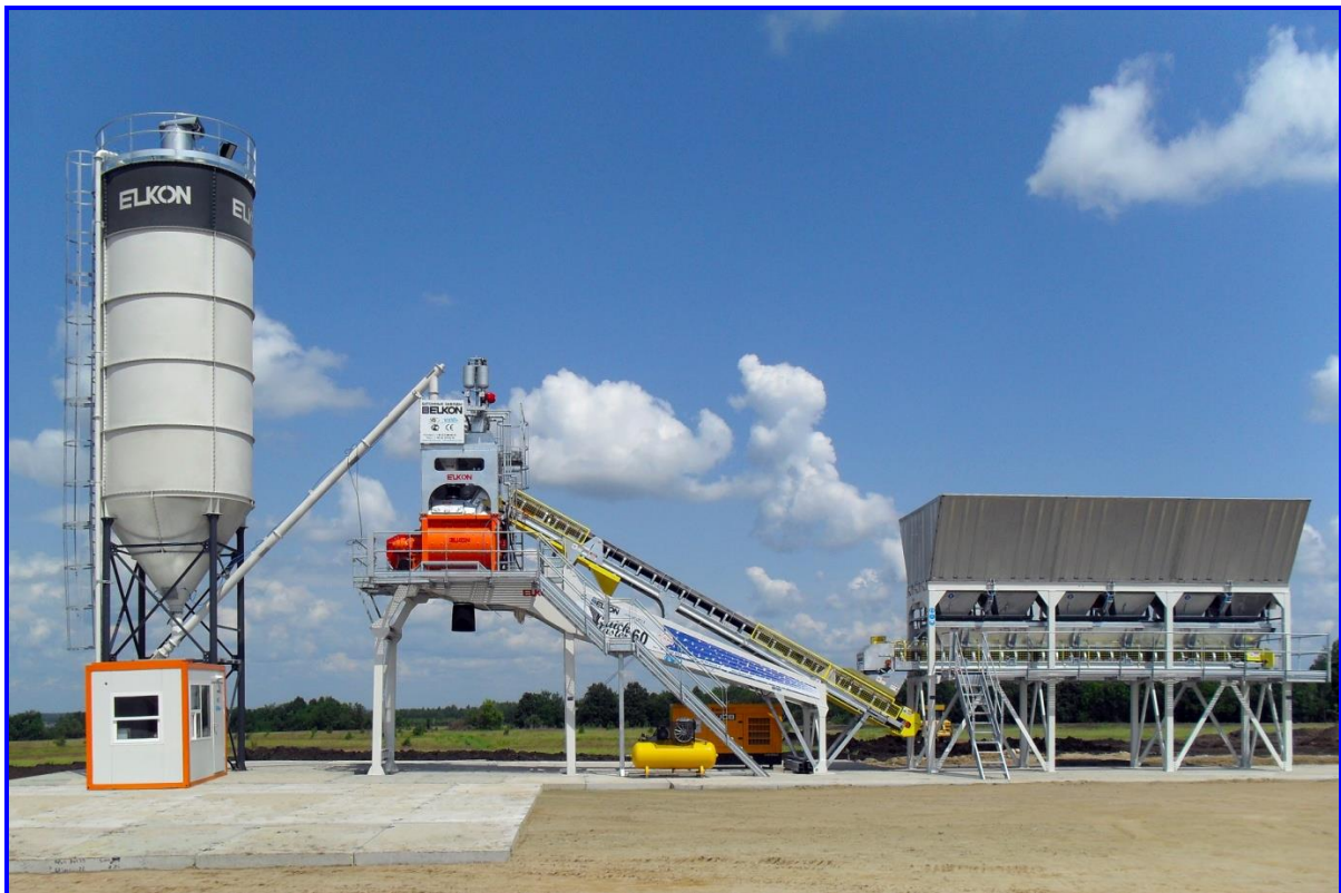
Фото-1. Общий вид установки по производству бетона

Отдозированная 3-я фракция дает сигнал на включение конвейера-дозатора. Инертные материалы подаются на наклонный конвейер , который подает материалы в двухвальный смеситель .